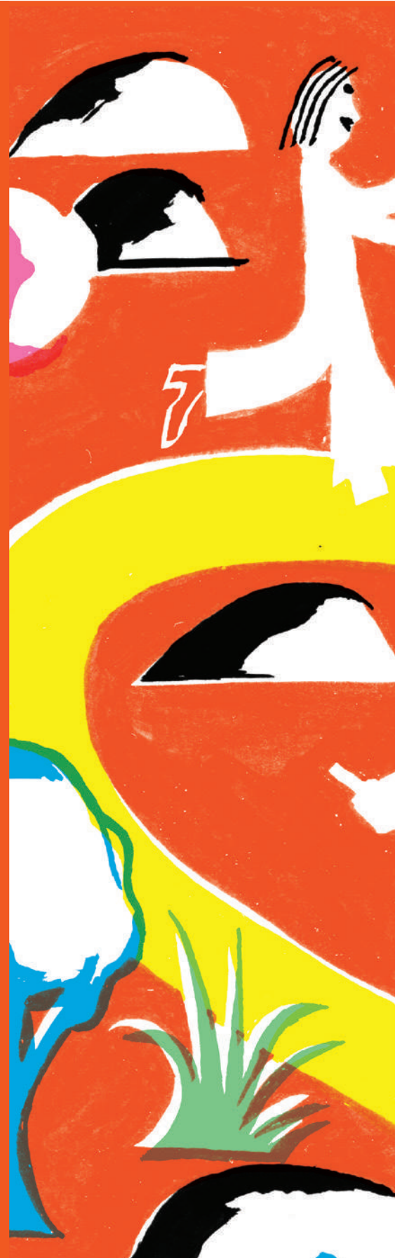
table ronde avec Alice Meteignier et Carole Thibaut Biennale des Illustrateurs de Moulins, cinéma CGR → biennaledesillustrateurs.com